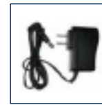
Adaptateur de courant